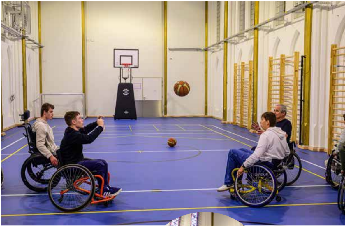
Snel, technisch en leuk om te doen.