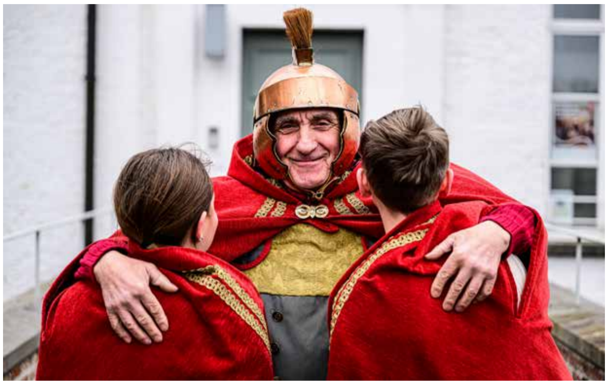
Sint-Maarten was een Romeinse soldaat die aandacht had voor wie het minder goed had.