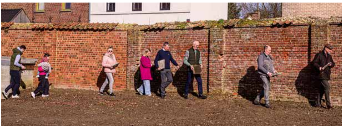
Jong en oud kunnen elkaar vaker treffen als de plannen gerealiseerd zijn.