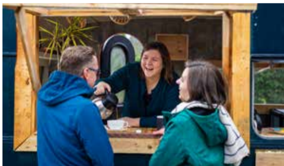
Waardevolle initiatieven ontstaan vaak dicht bij de mensen.